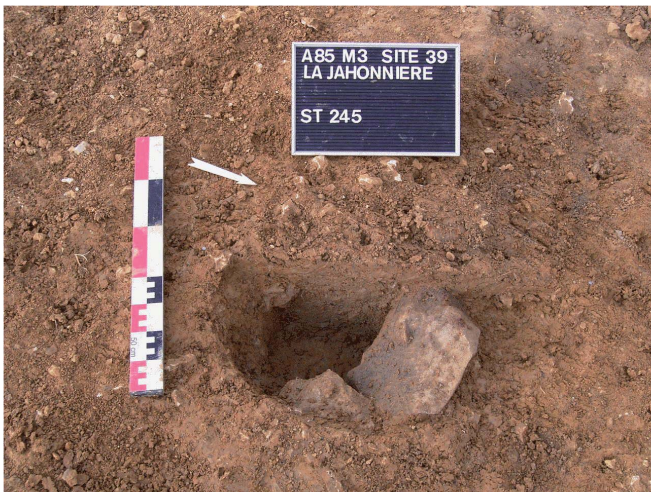
Document 2. Exemple de trou de poteau, avec pierres de calage.