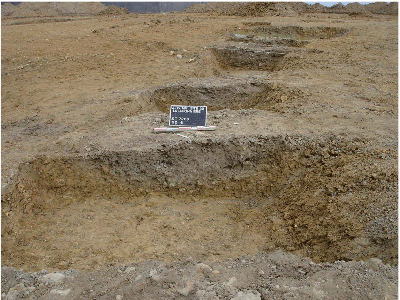
Document 1. Vue du fossé sud-est de l'enclos médiéval.