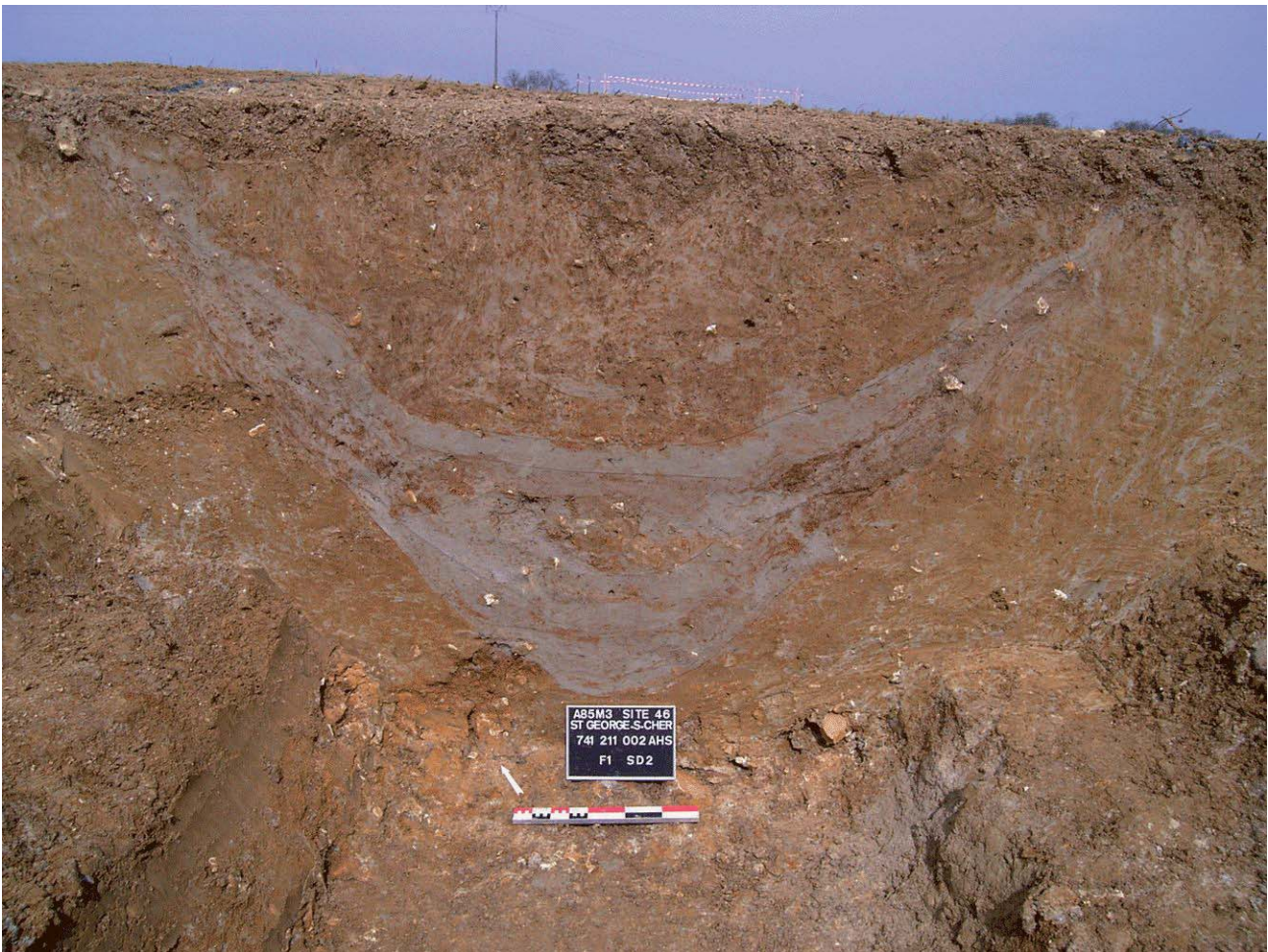
Document 2. Coupe du fossé d'enclos La base du comblement très argileux et gris atteste de la présence d'eau en permanence au fond du fossé.