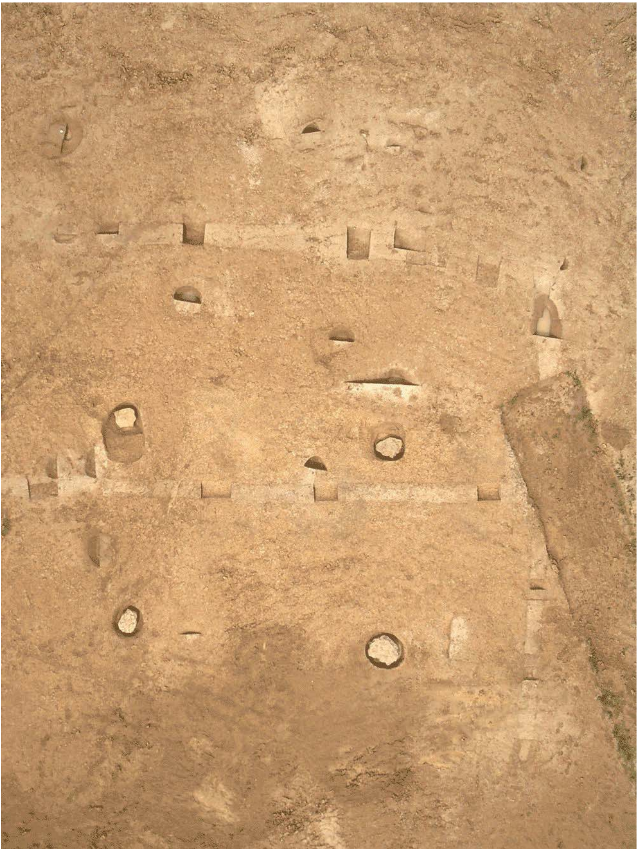
Document 1. Vue zénithale du grand bâtiment à plan centré, avec, au centre, les quatre fosses d'installation des poteaux porteurs de l'édifice, et, autour, la trace des parois ; au fond des fosses, des dalles massive en perron permettent d'isoler et d'asseoir solidement la fondation des poteaux (cliché P. Neury, Inrap, 2005).