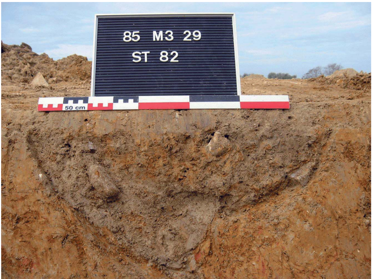
Document 2. Photographie de la coupe du fossé F82.