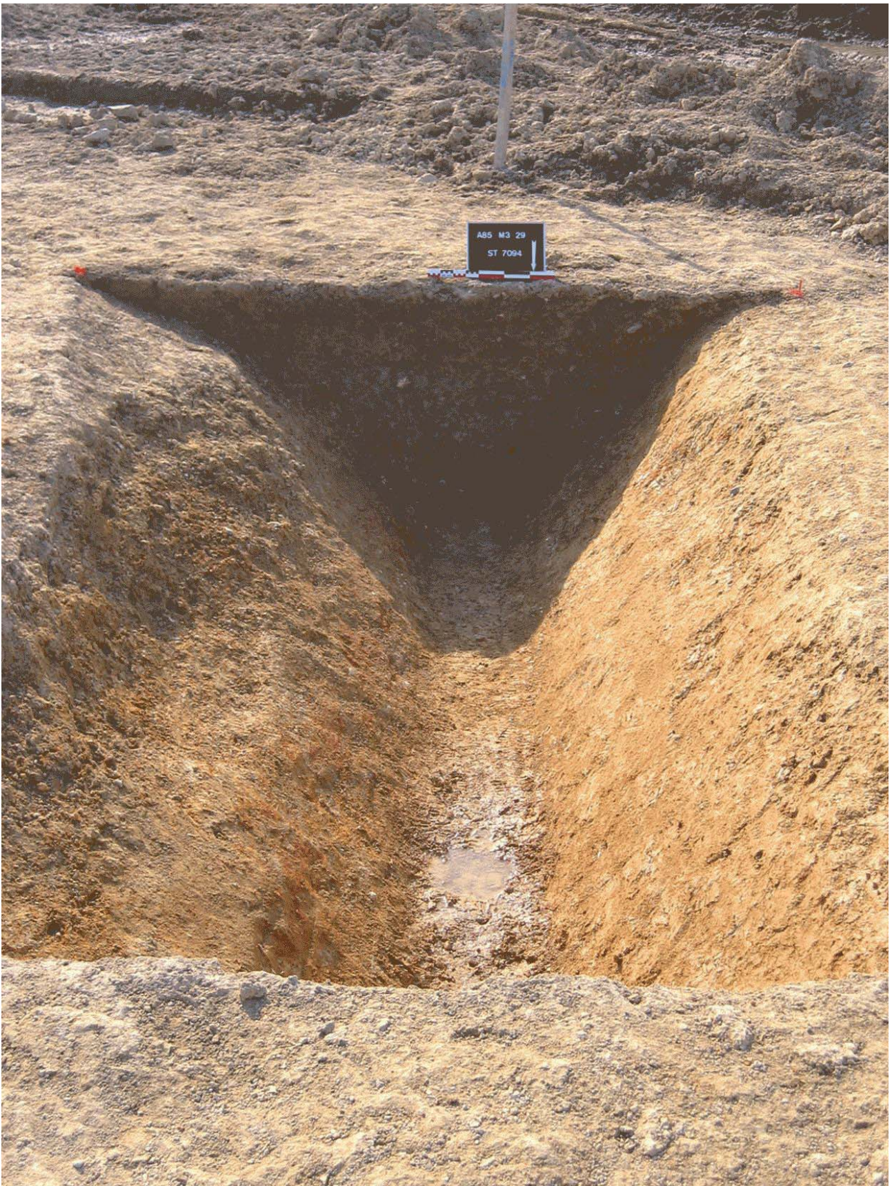
Document 3. Photographie de la coupe du fossé F7094 vers le Nord.